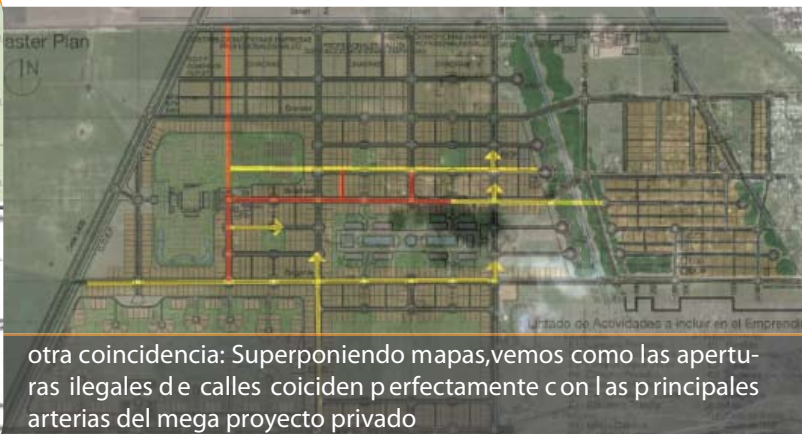
otra coincidencia: Superponiendo mapas, vemos como las aperturas ilegales de calles coinciden perfectamente con las principales arterias del mega proyecto privado